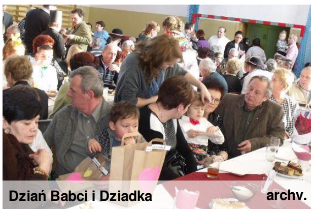
Dzień Babci i Dziadka archv.