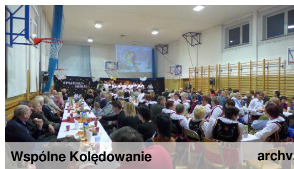
Wspólne Kolędowanie