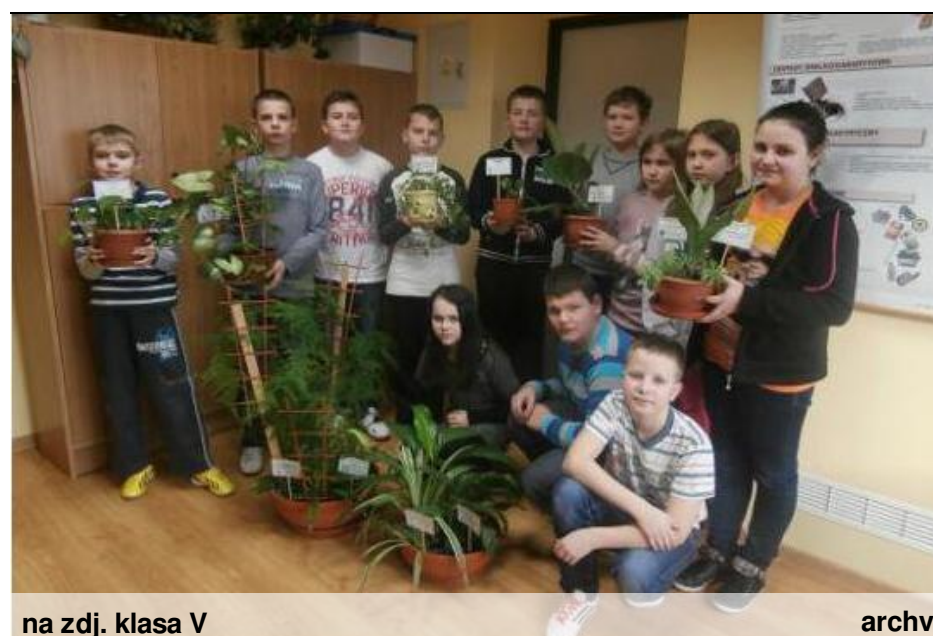
na zdj. klasa V

i opisane gatunki kwiatów, oraz przestrzeganie zasad właściwej opieki nad nimi. Warto pochwalić kl. III i VI za posiadanie kwiatów "wysokich" oraz kl. IV za zróżnicowanie gatunkowe kwiatów! Konkurs zachęcił nas do sumiennej pielęgnacji roślin! tekst: madzialena