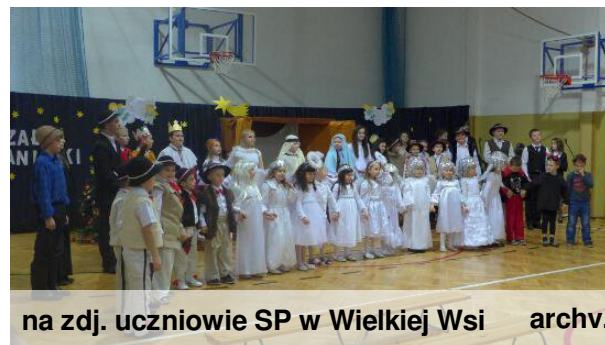
na zdj. uczniowie SP w Wielkiej Wsi

ukazują piękno naszej polskiej tradycji. Do śpiewu dołączyła Rada Rodziców oraz zespół z Bębła, który specjalnie na tę okoliczność przygotował życzenia w formie śpiewanej. Zwieńczeniem spotkania było przedstawienie o królu Herodzie wykonane przez grupę Herody z OSP Wielka Wieś. Sobotnie spotkanie było doskonałą okazją do integracji naszej społeczności lokalnej.