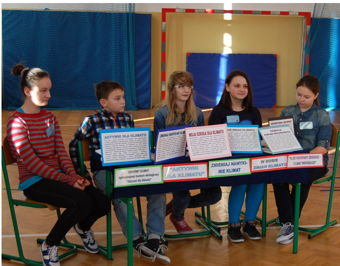
na zdj. Ekozespół "Badacze"

- tak mówią uczniowie, którzy włączyli się w akcję Aktywni dla klimatu.