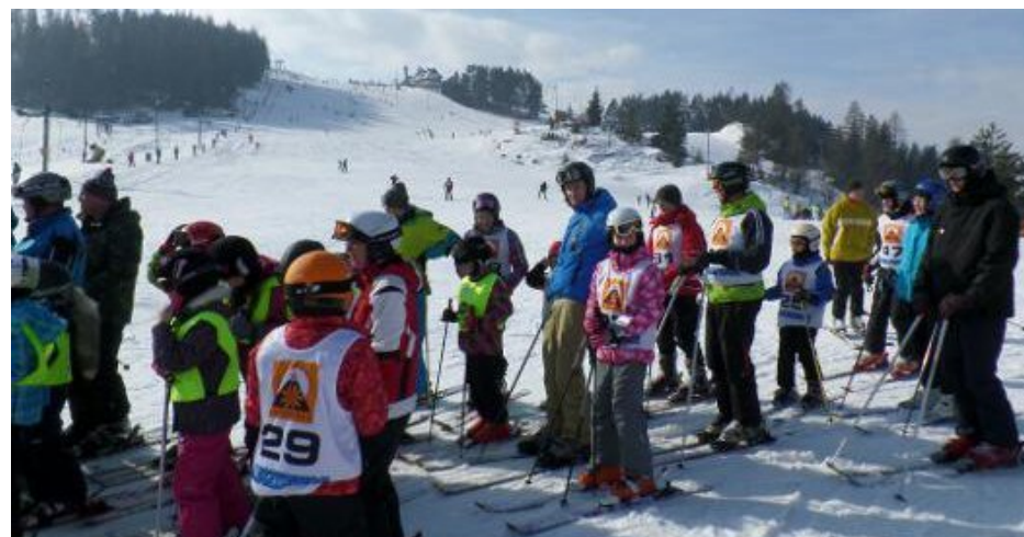
Nasi uczniowie na Mistrzostwach