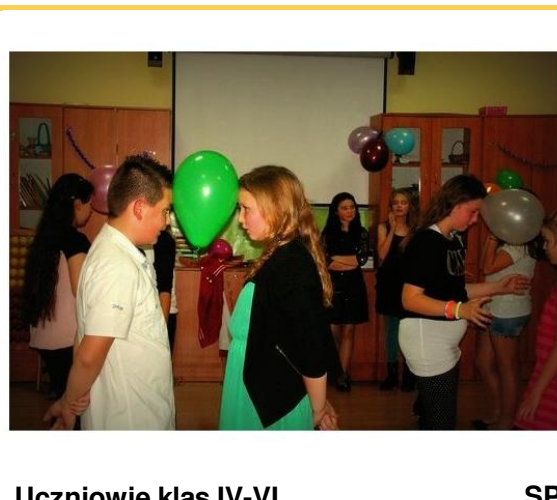
Uczniowie klas IV-VI